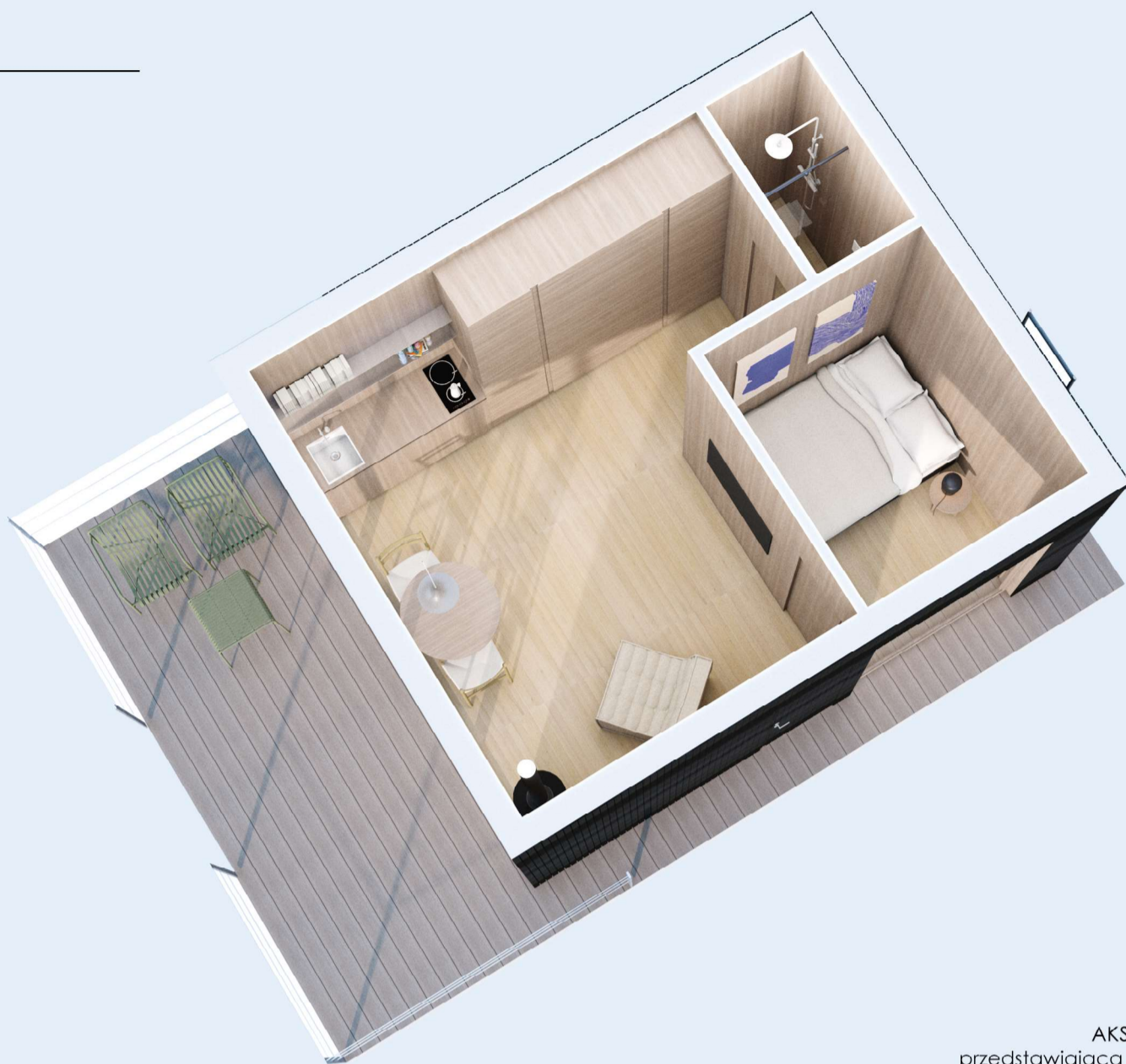
AKSONOMETRIA przedstawiająca przykładowe wyposażenie